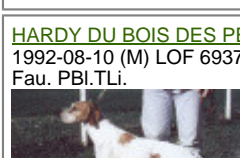
HARDY DU BOIS DES PERCHES 1992-08-10 (M) LOF 69375 (CH IT) - Fau. PBI.TLi.