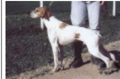
TESS 1994-05-01 (F) LOI PT186111 - BIANCO NERO MASCHERA SIMMETRICA