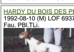
HARDY DU BOIS DES PERCHES 1992-08-10 (M) LOF 69375 (CH IT) - Fau. PBI.TLi.