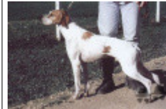
IALA DEL CELO 1991-08-16 (F) LOI PT173525 (CH(IT)T) - BIANCO FEGATO