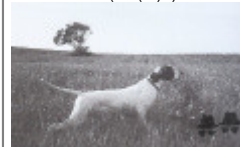
CLASTIDIUM FAUNO 1993-03-15 (M) LOI PT180209 (CHIT) - BIANCO CON MACCHIE NERE SUL CORP