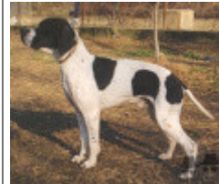
ROMINA (F) LOI PT198497 (CH(IT)T) - BIANCO NERO MASCHERA