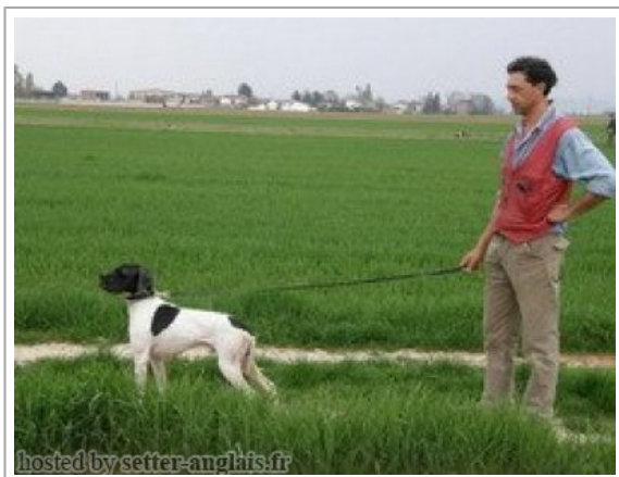
hosted by setter-anglais.fr

2007-06-02 (M) LOI LO0843178 Couleur : BIANCO NERO / Titres : CH GQ fiche affixe