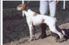
TESS 1994-05-01 (F) LOI PT186111 - BIANCO NERO MASCHERA SIMMETRICA