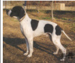
ROMINA (F) LOI PT198497 (CH(IT)T) - BIANCO NERO MASCHERA