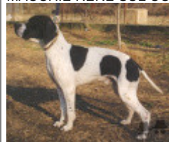
ROMINA (F) LOI PT198497 (CH(IT)T) - BIANCO NERO MASCHERA