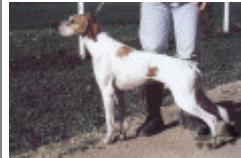
TESS 1994-05-01 (F) LOI PT186111 - BIANCO NERO MASCHERA SIMMETRICA