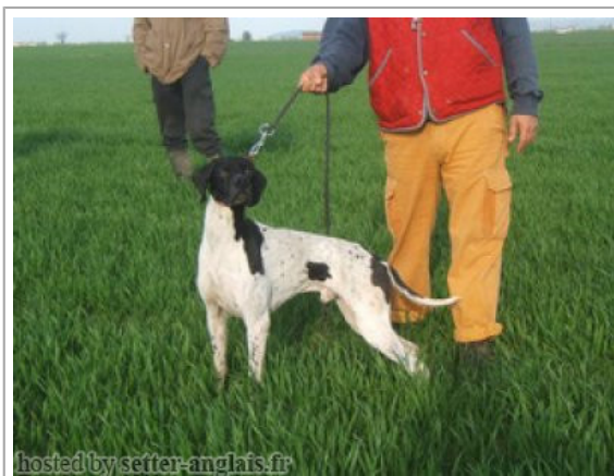
hosted by setter-anglais.fr

2006-04-15 (M) LOI LO0696335 Couleur : BIANCO NERO MACCHIE DORSALI