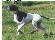
IMAGE DU BOIS DE MOUN 1993-10-23 (F) LOF 71917 - Noi. PBI.Env.

FRAY DU RIOU DE LA CUVE 1990-05-13 (M) LOF 63556/8313 (VCF, CHIT, CH A, CH P, CH T, VOF/FTP) - Noi. PBI.TLi.