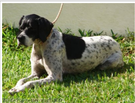
hosted by setter-anglais.fr