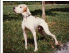
EDDY (F) LOI 171935