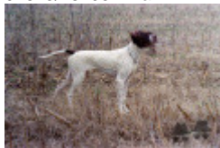
L'OCOCOTTE DE LA DEMI-BRUME 2003-06-08 (F) LOF 89789/16671 (TRGQ) - Noi. PBI.Env.

Mother DOUCE FRANCE DE LA DEMI-BRUME 2008-07-30 (F) LOF 97813/18296 - Mar. PBI.Env.