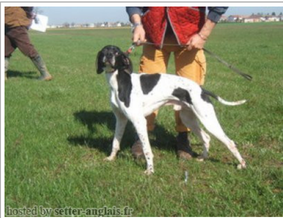
hosted by setter-anglais.fr

2006-04-15 (M) LOI LO0696334 Couleur : BIANCO NERO MACCHIE DORSALI