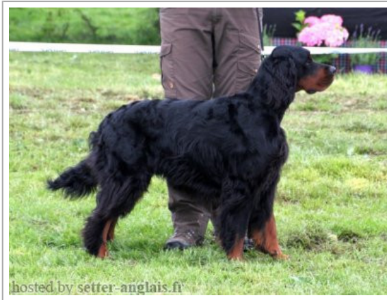
hosted by setter-anglais.fr

2015-08-21 (M) LOF 44420 Couleur : Noï. Mar.Fau. / Titres : CHEN / Dyspl. : B fiche affixe